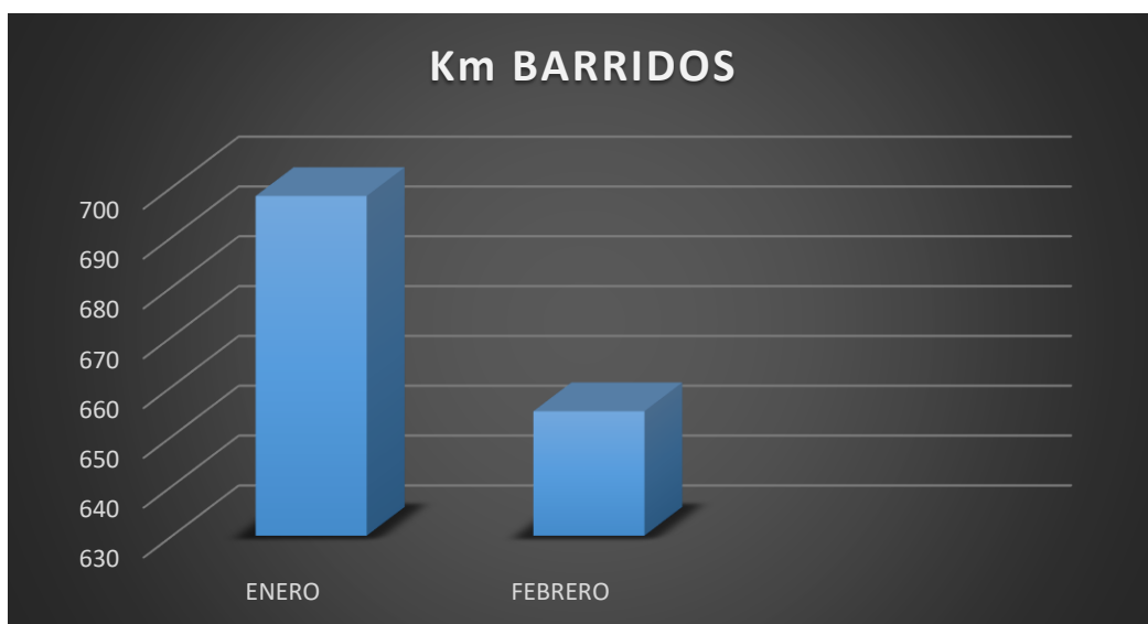
Grafico 1. Comparativo de kilómetros barridos del mes enero y febrero 2025.

Del cuadro 1 se cuantifica un total de 655.8 km barridos de calles céntricas de la ciudad de Cayambe del 01 al 28 de febrero de 2025, con una cobertura promedio del 86.4%.